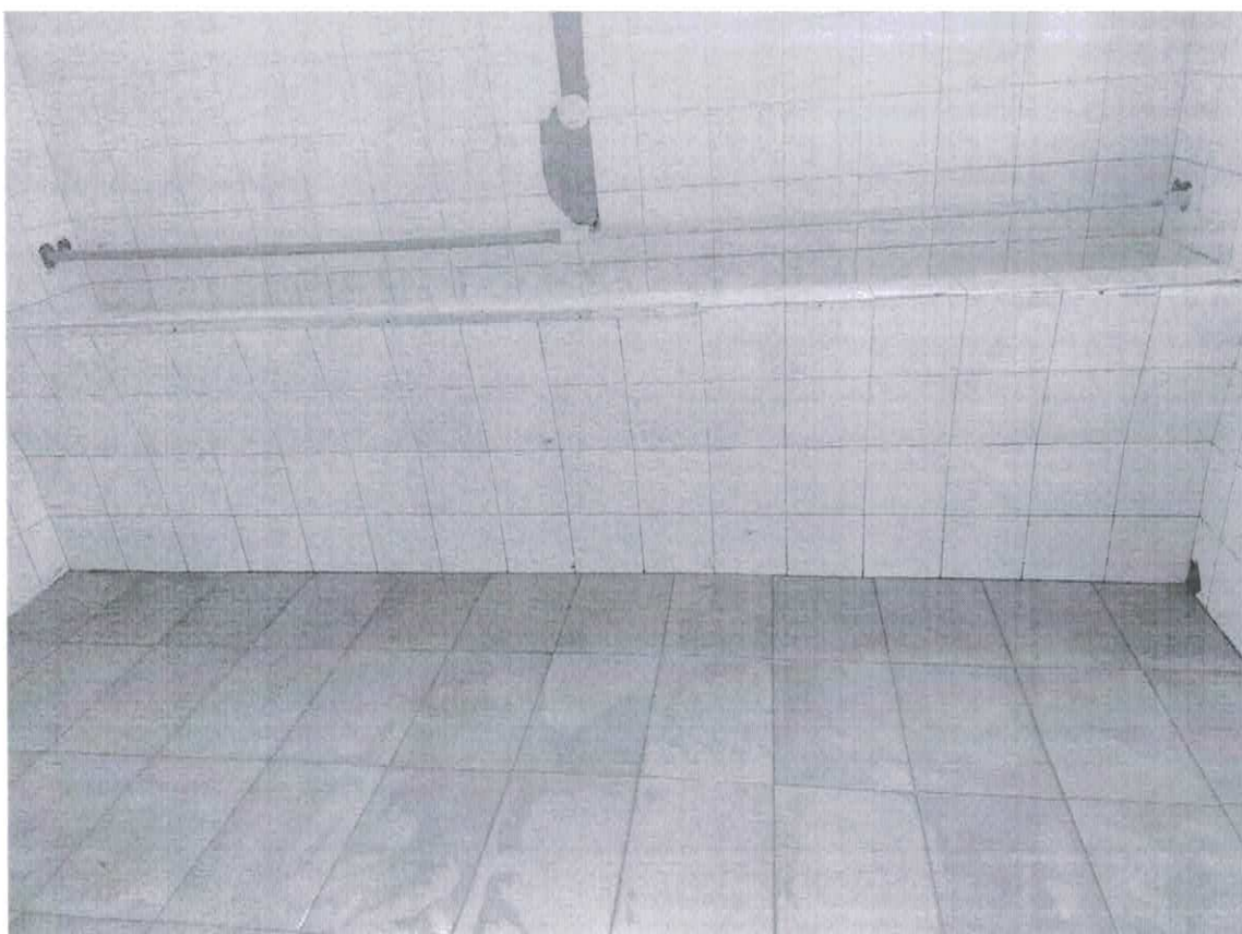
Figura 2: Foto do Vestiário; Devido a falha Hidraulica e estrutura defasada os vestiarios mostrados na figura 02 estão interditados desde o ano de 2019

A handwritten signature in blue ink, consisting of several fluid, overlapping strokes.