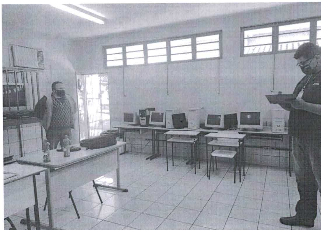
Figura 3: na figura 03 os computadores periféricos e Ar condicionado da sala de tecnologia não estão operáveis, são máquinas defasadas e que necessitam de substituição a maioria dos computadores não funcionam