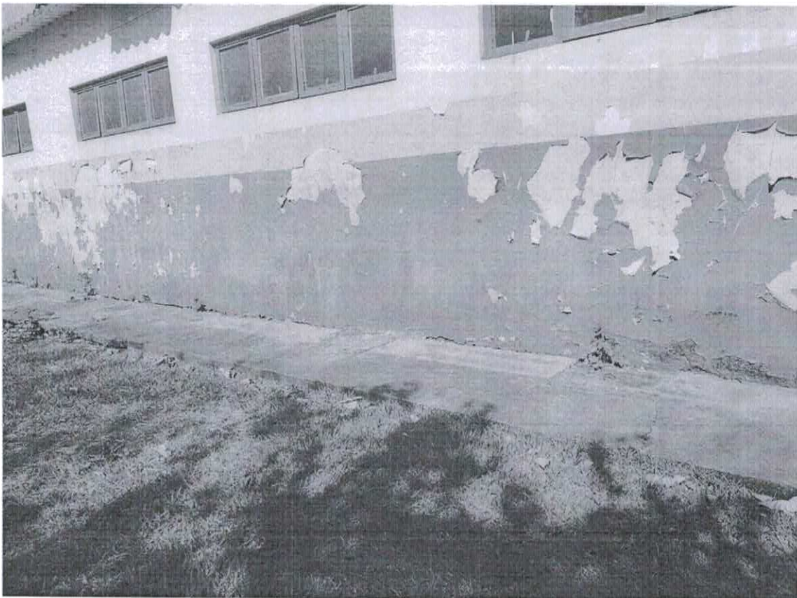
Figura 1: Na figura 01 nota se o desgaste e as infiltrações na pintura externa, importante ressaltar que esse cenário se encontra em toda a área externa da escola.